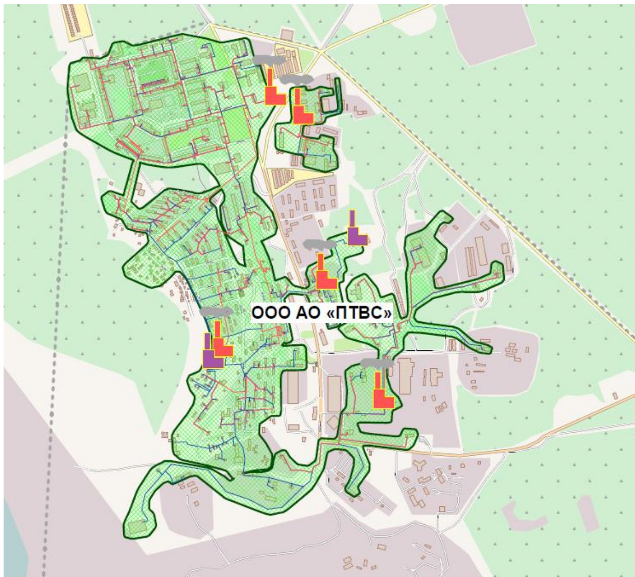
Рисунок 2 – Зона деятельности ООО АО «ПТВС»

Зона деятельности организации ООО АО «ПТВС» приведена на рисунке 2.