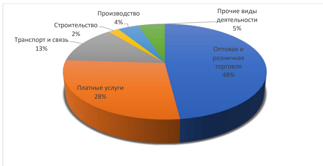
Диаграмма 2. Усредненные показатели структуры малого предпринимательства в МО «Поселок Айхал»

Традиционно наиболее привлекательной сферой деятельности для малого бизнеса остается сфера торговли. Хотя в последнее время успешно и охотно открывают свое дело предприниматели в сфере бытового обслуживания, строительстве (ремонтные работы), в профессиональной деятельности и в организации отдыха (Таблица 2).