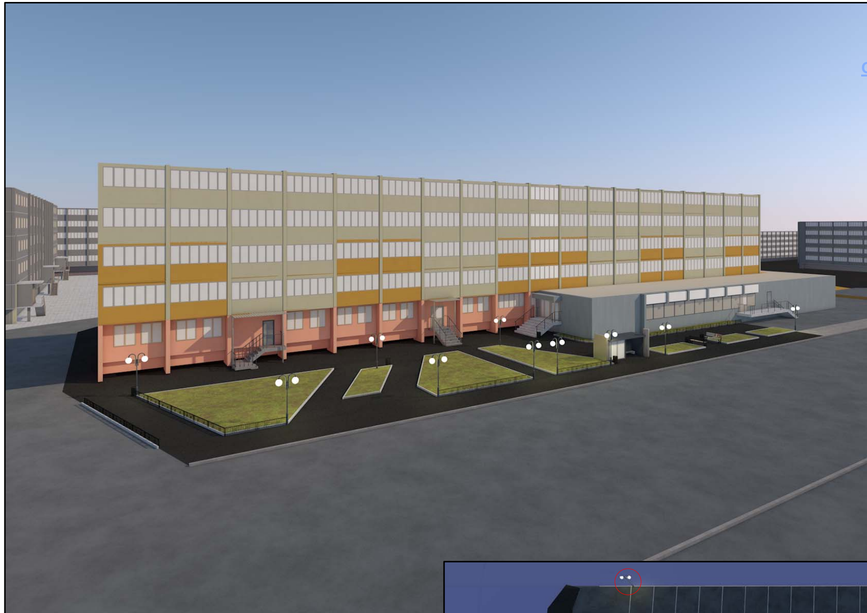
Общая Перспектива (4)